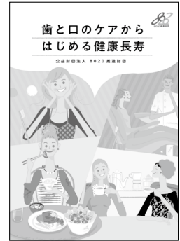
「歯と口のケアからはじめる健康長寿」 B5版 20頁 オールカラー 本体 115円 + 税 (送料別)