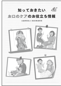
「知っておきたい お口のケアのお役立ち情報」 B5版 20頁 オールカラー 本体 115円 + 税 (送料別)

小冊子の購入をご希望のみなさまには下記購入申込書にご記入のうえ、FAXにて(株)法研までお申し込みください。なお、ご不明な点がございましたら、下記までお問い合わせください。