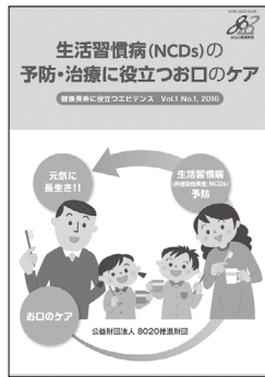
「生活習慣病(NCDs)の 予防・治療に役立つ お口のケア」 B5版 20頁 オールカラー 本体 115円 + 税 (送料別)