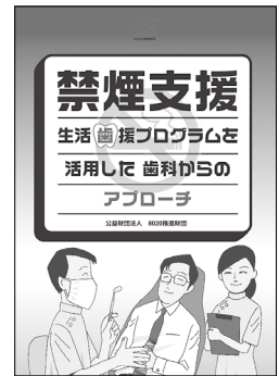
「禁煙支援 生活歯援プログラムを 活用した 歯科からのアプローチ」 B5版 20頁 オールカラー 本体 115円 + 税 (送料別)