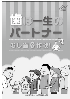
「歯は一生のパートナー」 B5版 20頁 オールカラー 本体 115円 + 税 (送料別)