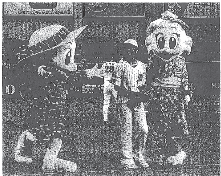
始球式の大役を終えて