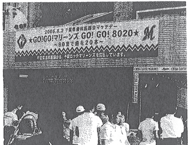
球場入口の「8020運動」の垂れ幕