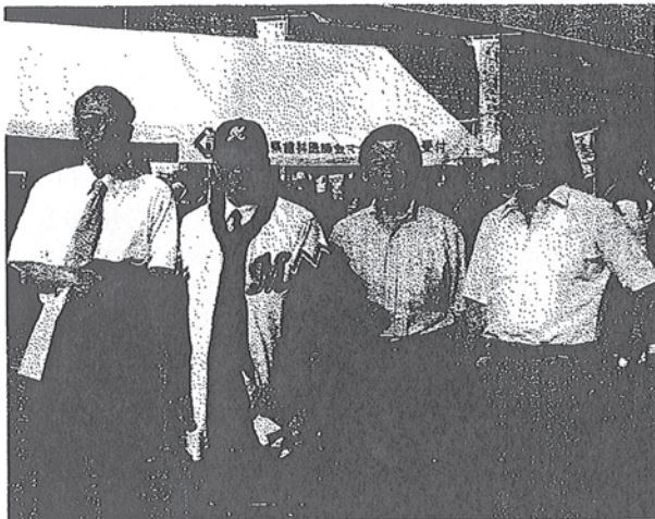
背番号8020のユニフォームを着た会長

神聖なグラウンドに、6人と一緒に入る私、そしてハイテンション阿部理事。それと、なぜか、幕張メッセで開かれている『世界の巨大恐竜博2006』の